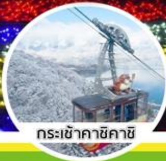
กระเช้าสายเคเบิล