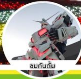
ชมกันดั้ม